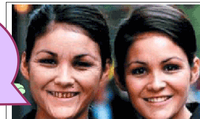
ACTION ON SMOKING AND HEALTH (米)

22歳の双子が40歳を迎えたときの予想です。喫煙によって顔色も悪くなりしわも増えてしまいます。